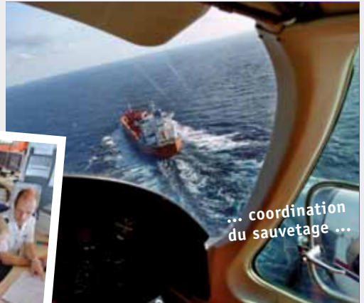
... coordination du sauvetage ...