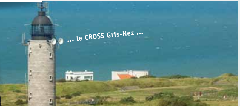
... le CROSS Gris-Nez ...