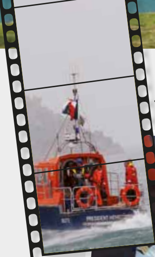
... la passerelle ...