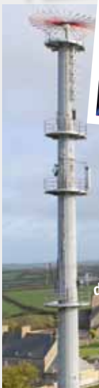
... les moyens de télécommunication ...