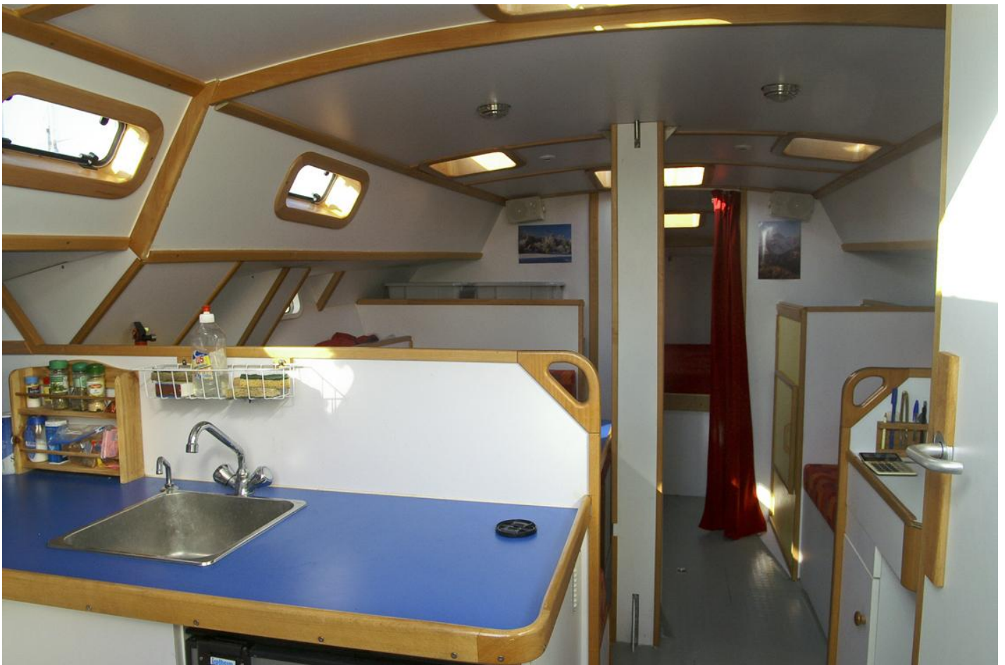
Vue sur l'avant du bateau