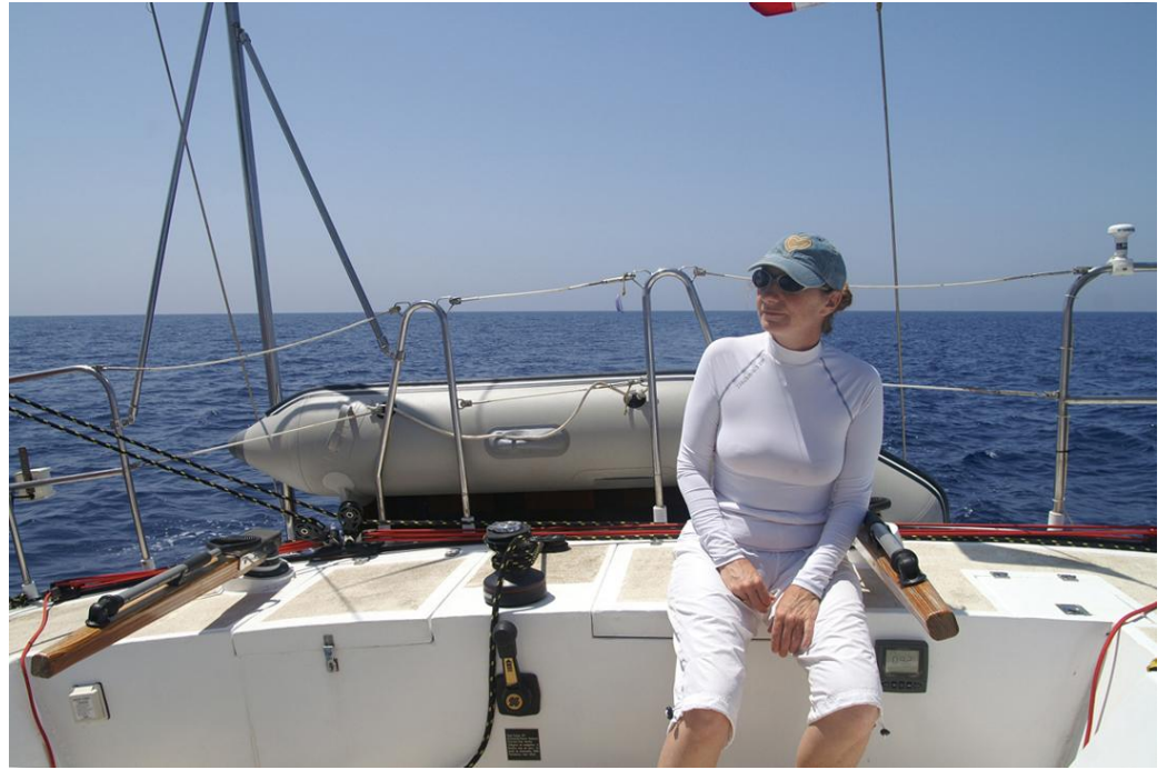
Un cockpit spacieux